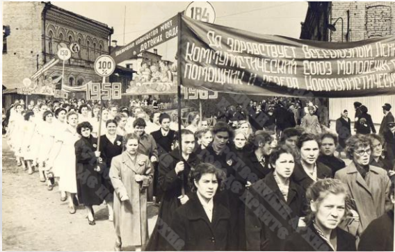
Первомайская колонна преподавателей и учащихся педагогического училища. 1959 г.